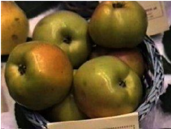
Ici les fruits ne sont pas assez insolés, ils doivent être colorés de rouge.

ORIGINE : Obtention , vers 1885 ou avant, de J.B. Duquesne, pépiniériste à Mons-Pont-Canal près Jemappes en Belgique. Cultivé vers les années 1930/40 à Bourg-la-Reine dans les pépinières Nomblot. Conservé à Brodgate, Kent, (the book of apples, 1993, p.192) ou la chair est considérée bonne mais astringente (ont-ils la bonne variété ?).